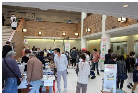
昨年の販売型マルシェ